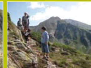
Imatges dels estanys de Tavascan i Mariola. I excursionistes per els senders que porten els estanys.