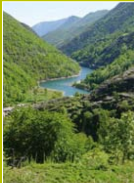
Imatges dels indrets de la Vall de Tavascan i les Bordes de Noarre.