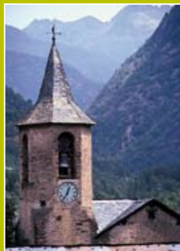
Imatges dels indrets de la Vall de Tavascan i les Bordes de Noarre.