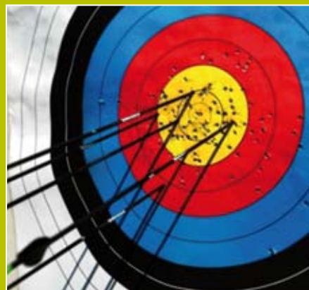
Pràctica en el camp de tir amb arc.